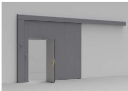
S88 kan utstyres med en innfelt gangdør.