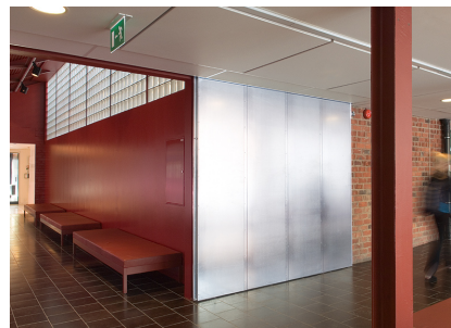
Korridorene ved dansehøgskolen i Stockholm er brannseksjonerte med S88