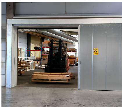
Brannskyveport S88 er vanlig som brannseksjonering i industrilokaler