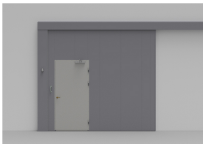
S88 kan utstyres med en innfelt gangdør. Brannklasse opp til EI 2 90/EW120.