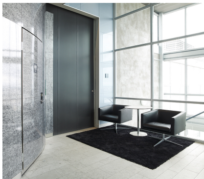
S88 i restaurant Skatteskrapan (Sthm)